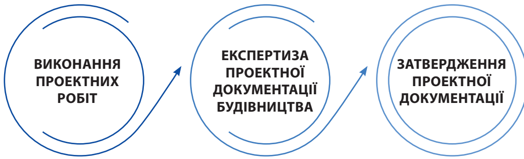
СХЕМА №1 БІЗНЕС-ПРОЦЕСИ НА РИНКУ

Ринок, який є предметом цього аналізу, стосується виконання робіт з архітектурного проектування і будівельного проектування та конструювання промислових та громадських будівель і споруд, у тому числі житлових.